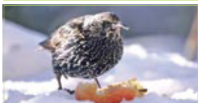
Star Etourneau sansonnet