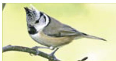
Haubenmeise Mésange huppée