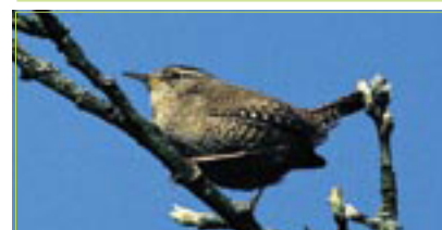
Zaunkönig Troglodyte mignon