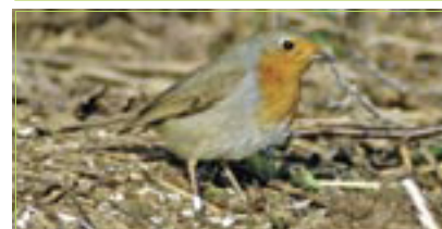
Rotkehlchen Rouge-gorge familier