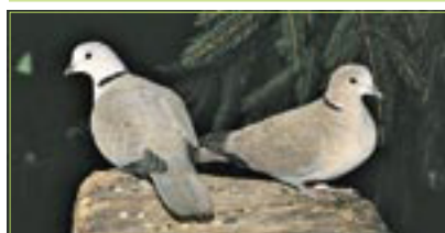
Türkentaube Tourterelle turque