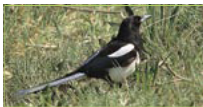
Elster Pie bavarde