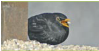
Amsel Merle noir