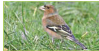
Buchfink Pinson des arbres