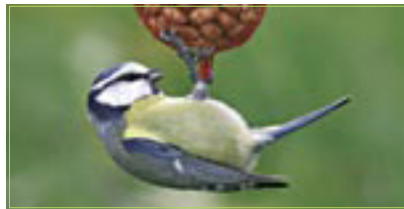
Blaumeise Mésange bleue