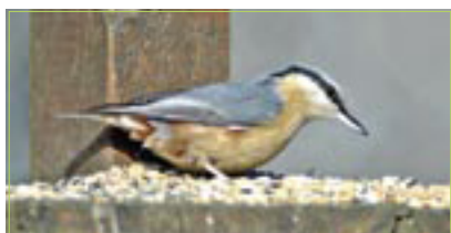
Kleiber Sittelle torchepot