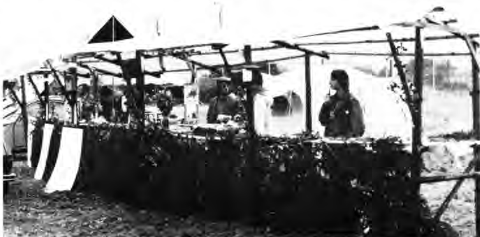
Ökologiefest in Biwer

– Vogelschutz: weiterhin selektiv, d.h. Hilfe für die Arten, die tatsächlich unsere Hilfe brauchen (Eulen, Wasserramsel). Winterfütterung und Nistkastenkontrollen zählen zu dem traditionellen Vogelschutz.