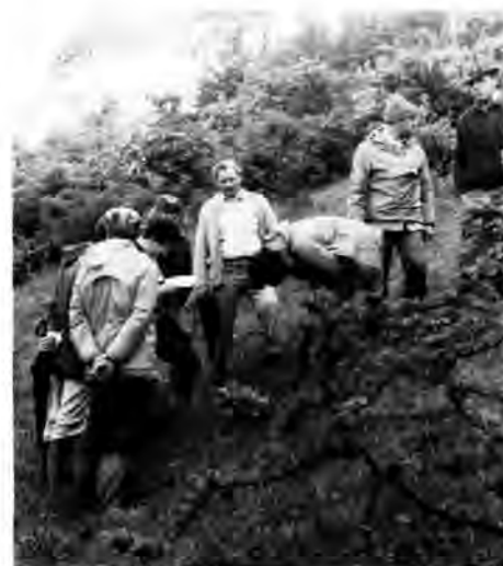
Besichtigung von ökologisch wertvollen Trockenrasen an der Untersauer (Sektion Born-Moersdorf; Biwer).