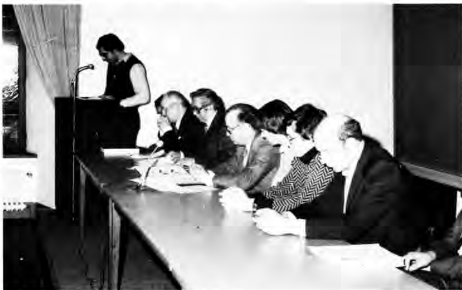
Ein Teil des Vorstandes der Sektion »Kanton Kliärrfer«