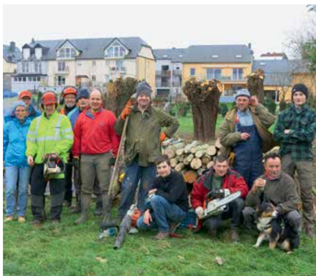
Eis Equipe beim Kappweideschneiden zu Ierpeldeng.