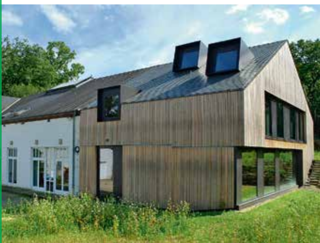
Am 23. September 2014 wurde die Vergrößerung des Haus vun der Natur auf Kockelscheuer eingeweiht, welche von der Stadt Luxemburg (2/3) und dem Nachhaltigkeitsministerium (1/3) finanziert wurde und vor allem dem Service Activités Nature der Stadt Luxemburg aber auch natur&ëmwelt zugute kommt.