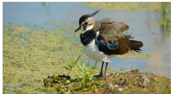
Kiebitz: Ein urspr nglicher Bewohner von Feuchtwiesen.

Es besteht dringender Handlungsbedarf, wenn Luxemburg verhindern will, dass eine weitere Vogelart ausstirbt.