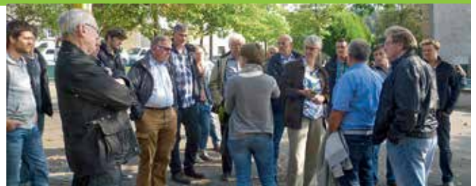
Die Teilnehmer des Seminars während der Exkursion Wärmedämmung und Artenschutz am 22. September 2014.

Unter dem Titel Wärmedämmung und Artenschutz - Lösungen für die Praxis organisierte natur&ëmwelt mit dem Sicono Westen und der Gemeinde Differdange ein Seminar, das die technischen Möglichkeiten zum vogelfreundlichen Bauen aufzeigte. Dabei ging es zum einen um die Schaffung von Nistgelegenheiten, zum anderen um eine vogelfreundliche Bauweise mit Glas. Gerade Niedrigenergie- und Passivhäuser, die eine gute Wärmedämmung und Energiebilanz aufweisen, bieten Vögeln und Fledermäusen keinen Lebensraum. Auch die Renovierung von Altbauten zieht den Verlust von Brutmöglichkeiten für die beiden Arten nach sich. Hier wurden Lösungsmöglichkeiten aufgezeigt, wie der Einbau von Niststeinen mit der Wärmedämmung bzw. Verkleidung der Fassade in Einklang gebracht werden kann. Auch der vermehrte Einsatz von Glas macht Vögeln zu schaffen. Gerade öffentliche Gebäude besitzen große Glasflächen, was vielen Vögeln zum Verhängnis wird. Jahr für Jahr sterben Millionen Vögel, weil sie ungebremst in