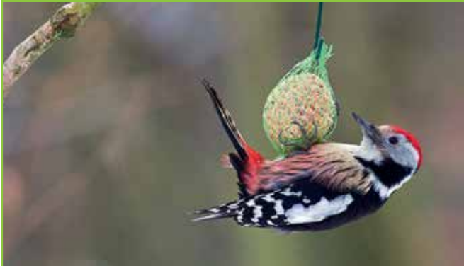
Ein seltener Gast am Futterplatz: der Mittelspecht.