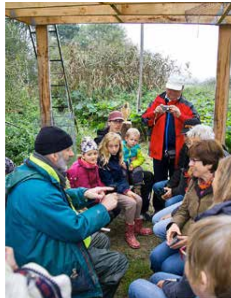
Birdwatch in Luxemburg

Eine große Herausforderung für natur&ëmwelt bestand in diesem Jahr in der Organisation des EuroBirdwatch. Am ersten Wochenende im Oktober beteiligen sich 40 europäische BirdLife Partner an einer groß angelegten Vogelzählaktion um die Migration in einer Momentaufnahme festzuhalten. natur&ëmwelt übernahm die Koordination von 1.184 Events in ganz Europa. Von Portugal bis Kasachstan und von Malta bis Norwegen kamen bei dieser groß angelegten Vogelbeobachtungsaktion mehr als 33.000 Besucher zusammen. Sie alle wollten sich über den Vogelzug informieren und selber beobachten. Noch am gleichen Abend wurden die 1. Ergebnisse der Presse bekannt gegeben. Darunter waren auch Meldungen wie z.B. aus Estland, wo die Besucher Zeuge eines dramatischen Vorfalls wurden. Ein junger Höckerschwan flog in eine elektrische Leitung und überlebte diesen Kontakt nicht. In den Niederlanden konnten die Besucher an diesem Wochenende über 1 Million Vögel zählen.