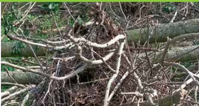
Zerstörte Nester in Merl

Der Bestand der Saatkrähen wurde 2014 im ganzen Land erfasst, um eine Übersicht von deren Verbreitung in Luxemburg zu erlangen. Die Saatkrähe brütet, anders als die Rabenkrähe