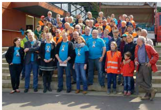
Der Startschuss der Grouss Botz – Aktionen fand 2014 am 29. März in Mondrange im Beisein der Umweltministerin und in Zusammenarbeit mit der Gemeinde statt.

Über einen Fragebogen wurden Informationen zu den Aktivitäten in den Gemeinden zusammengetragen. Bei mehr als 60 Aktionen sammelten die ca. 4.000 Teilnehmer mehr als 10 Tonnen und 40 m 3 Dreck ein.