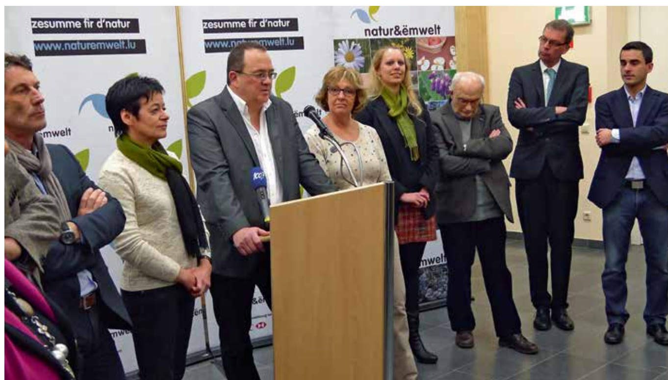
En présence de la nouvelle Ministre de l'Environnement Carole Dieschbourg et du Secrétaire d'Etat Camille Gira, la réception du Nouvel An 2014 de natur&ëmwelt a eu lieu le 13 janvier au Centre St. Jean à Luxembourg.