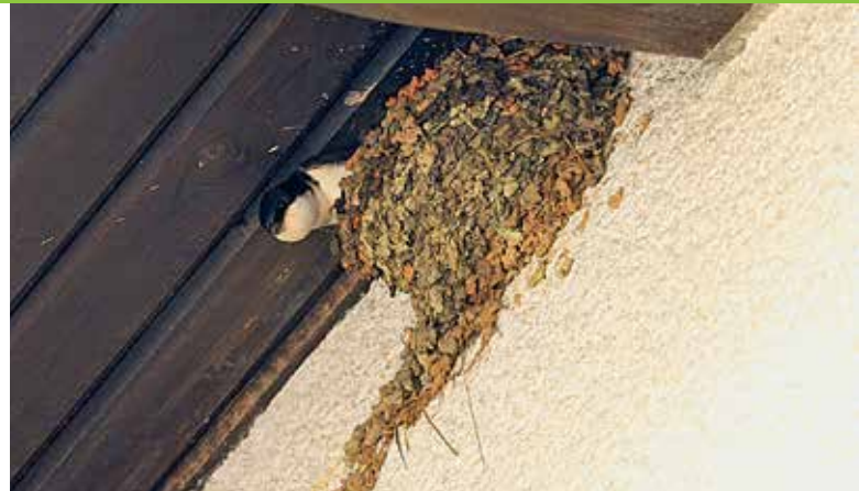
Wo die Schwalbe ihr Nest baut, bringt sie den Bewohnern Glück und Frieden.

Im vergangenen Jahr startete natur&ëmwelt die Aktion „Wir suchen Luxemburgs Schwalbenfreunde“. Auf diesen Aufruf meldeten sich 39 Bürger, die Schwalbennester an ihren Häusern oder in ihren Ställen haben. Neben den Besitzern von Privathäusern, Pferdegestüten und Bauernhöfen gab es auch Firmen, an deren Gebäuden die Schwalben willkommen sind. Nun sollen in diesem Frühjahr die Schwalbenfreunde auch im Rahmen einer offiziellen Veranstaltung mit der Umweltministerin geehrt und mit einer Schwalbenplakette ausgezeichnet werden. Zusätzlich zu diesem Aufruf wurde auch versucht der Bestand der Mehlschwalbe im ganzen Land zu erfassen. Hierfür möchte sich die Centrale ornithologique bei allen ehrenamtlichen Kartierern, die viele Stunden für die Erfassung im Einsatz waren, herzlich bedanken.